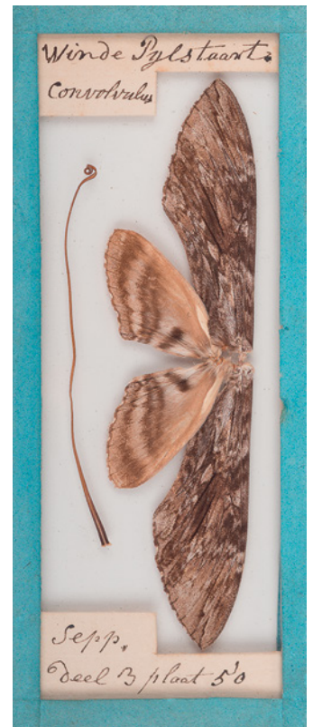
7. Agrius convolvuli uit het vlinderkastje, met verwijzing naar Sepp deel 3, plaat 50. 7. Agrius convolvuli from the butterfly cabinet, with reference to Sepp part 3, plate 50.