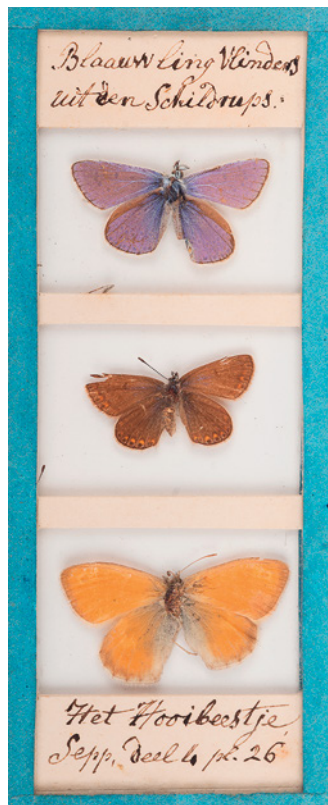
5. Polyommatus icarus en Coenonympha pamphilus uit het vlinderkastje, met verwijzingen naar Sepp deel 1, plaat 37 en deel 4, plaat 26. 5. Polyommatus icarus and Coenonympha pamphilus from the butterfly cabinet, with reference to Sepp part 1, plate 37 and part 4, plate 26.