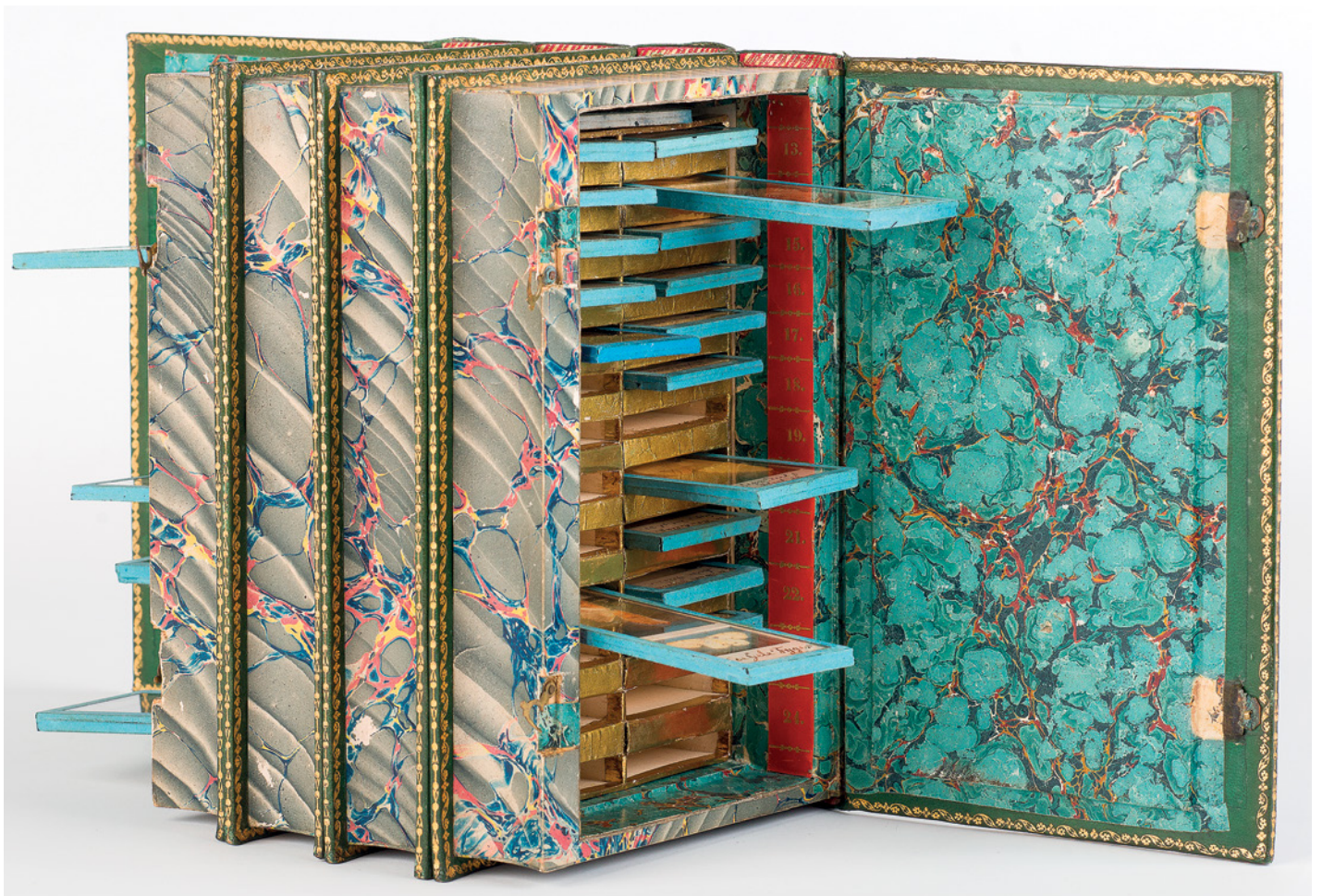
2. Geopende 'boeken' met vlinders. 2. Books opened showing butterflies.