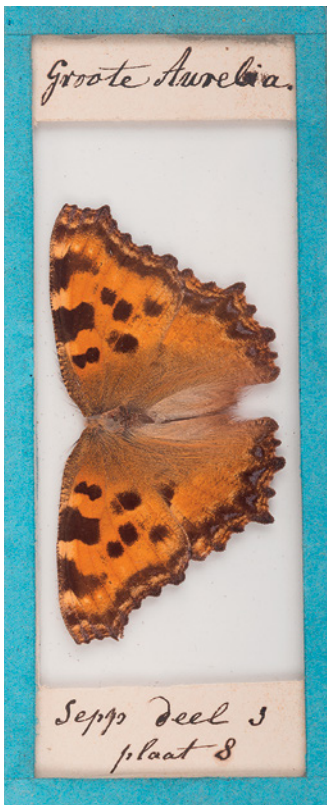
4. Nymphalis polychloros uit het vlinderkastje, met verwijzing naar Sepp deel 1, plaat 8. 4. Nymphalis polychloros from the butterfly cabinet, with reference to Sepp part 1, plate 8.