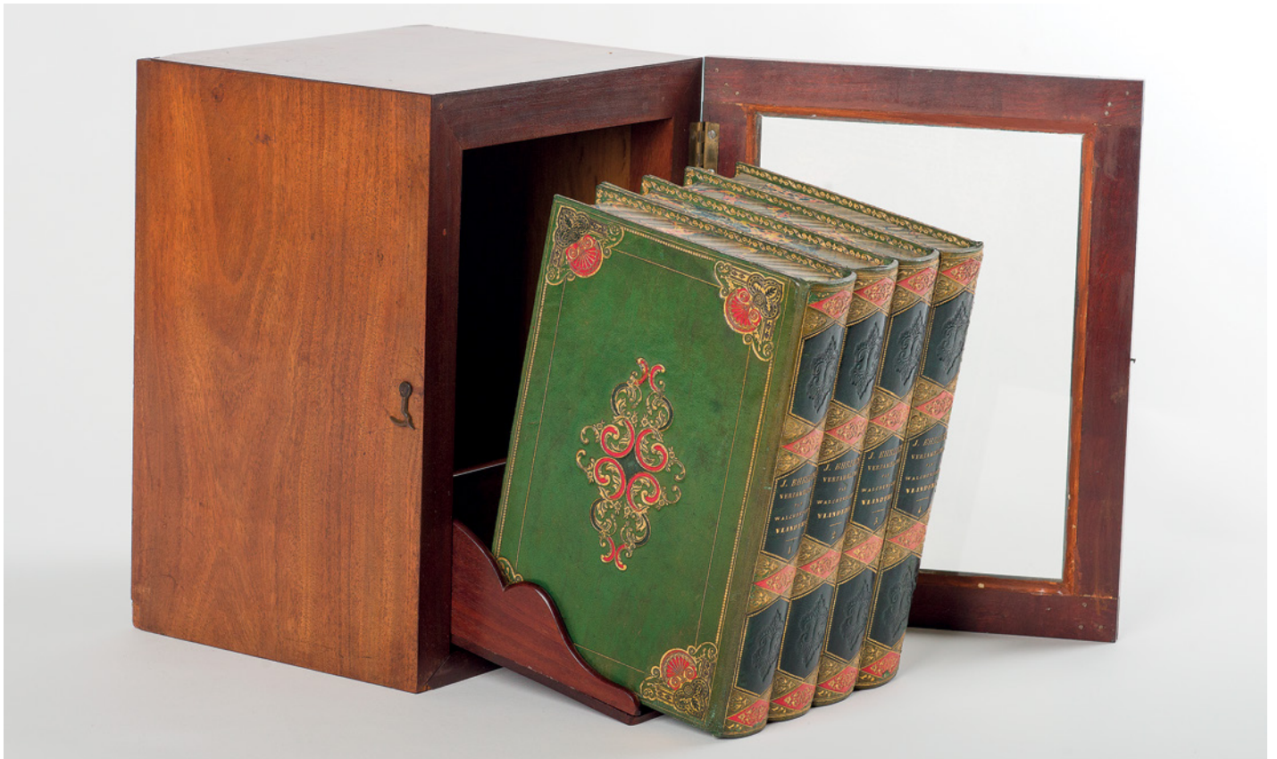
1. Vlinderkastje met 'boeken'. 1. Cabinet with book-case.