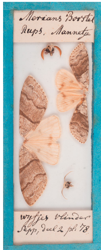
6. Calliteara pudibunda uit het vlinderkastje, met verwijzing naar Sepp deel 2, plaat 78. 6. Calliteara pudibunda from the butterfly cabinet, with reference to Sepp part 2, plate 78.